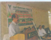
മുഖാമുഖം - കേരള ഉത്പന്ന സംരംഭങ്ങളും സാധ്യതകളും