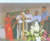
ബോധവൽക്കരണ സെമിനാർ - സസ്യ ഇനങ്ങളുടെ സംരക്ഷണവും കർഷകരുടെ അവകാശങ്ങളും